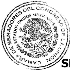
SEN. JOSÉ GONZÁLEZ MORFÍN Vicepresidente